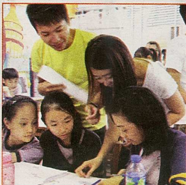
▲「社建師集」得到企業支持，出錢出力讓學生學得更多更廣。