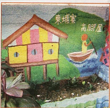
▲學生學習不同地區的建築風格，有助了解該國的文化背景。

社建師集 電話：6400 7319 網址： www.communitybuilders.com.hk